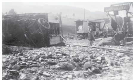
Převrácený vůz lodičkové houpačky J. Thanhäusera ze Sobotína u č. 128