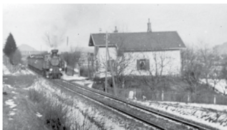
Drážní domek (snímek F. Kutschera, 1927)