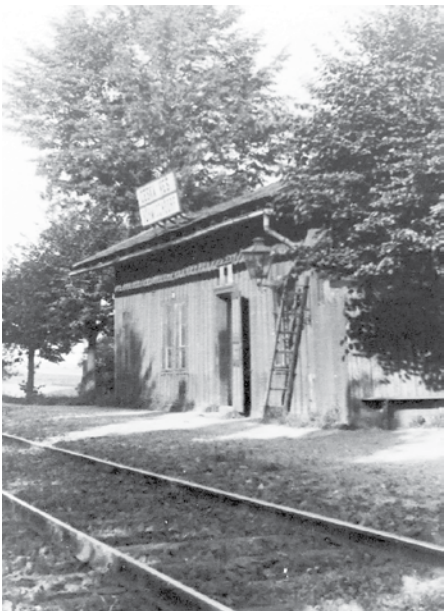
Zastávka Česká Ves

remízem dojdeme až k zastavení U Kolejí. Po celou dobu se můžete kochat pohledem na vrcholky Hrubého Jeseníku. V případě krásného počasí budete mít Praděd jako na dlani.