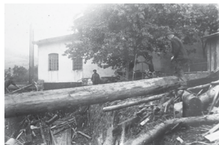
Budova mlýna Heinricha Schlesingera, dům č. 271