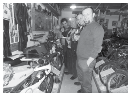
Delegace veterán klubu z polských Glucholaz zdraví i občany České Vsi