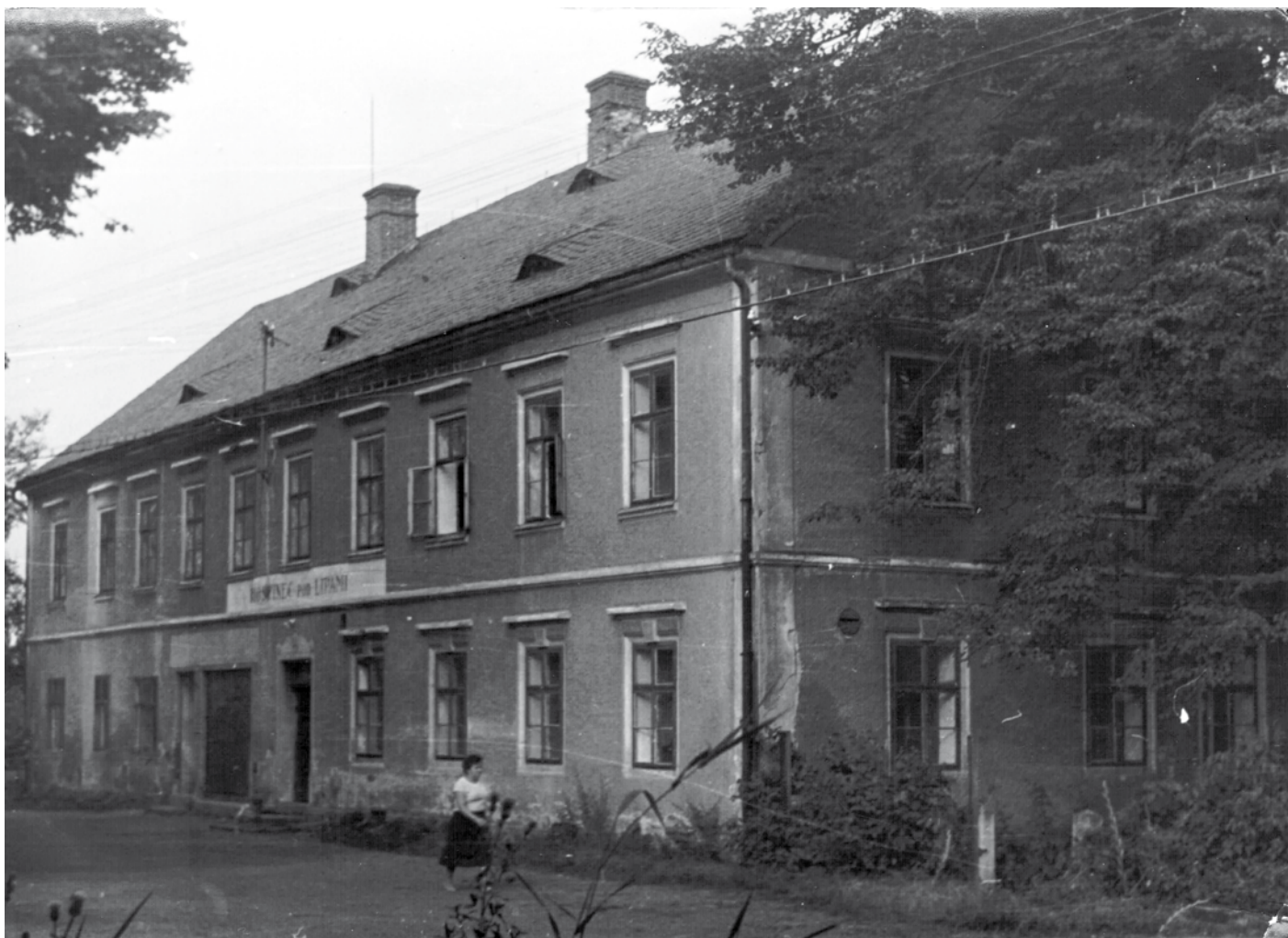
Hostinec Pod lipami