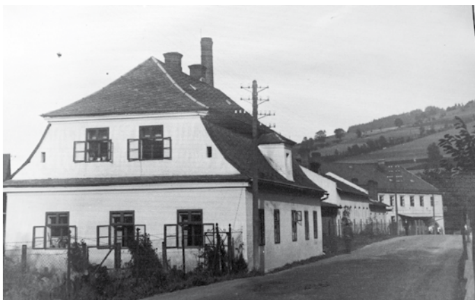
Bělidlo Česká Ves, dům č. 242

Roku 1836 byla dnešní obytná budova č. 242, vybudova-