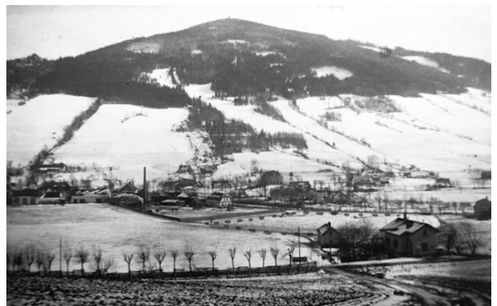
Místo bělení u Rychtářské bělárny