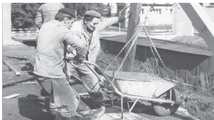
Práce na stavbě Krytého bazénu v České Vsi

• I v zimních měsících, pokud vysvitne sluníčko a není velká zima, je hojně využíván nově vybudovaný fitpark s posilovacími stroji na zadní cestě na dolním konci obce. Zdá se, že jeho vybudování byla dobrá volba.