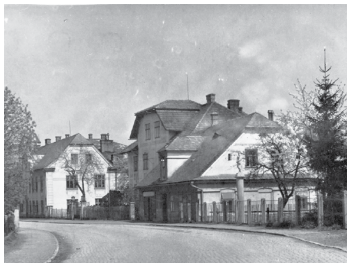
Sahánkovo řeznictví kolem roku 1950

• Minulý měsíc se rozjela zajímavá diskuse na palčivý problém, který se netýká jen naší obce. Možná by se někteří milovníci psů mohli nad sebou zamyslet. ( https://www.facebook.com/roman.janas/posts/10204248900101266 )