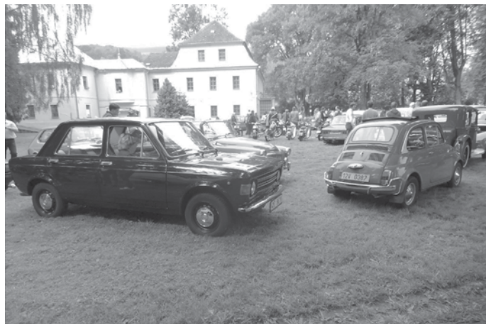
V sobotu 6. srpna 2016 pořádal Klub historických vozidel (KHV) v Bruntále orientační soutěž auto-moto veteránů. Soutěž se konala ve Vrbně pod Pradědem a z našeho Veterán klubu se zúčastnilo 6 jezdců na motocyklových veteránech, dvě dvoučlenné posádky ve Velorexech a dvě dvoučlenné posádky s automobilovými veterány.