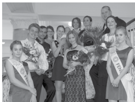
Aktéři „Priessnitzovské nadstavbové procedury pod názvem Opera s láskou“