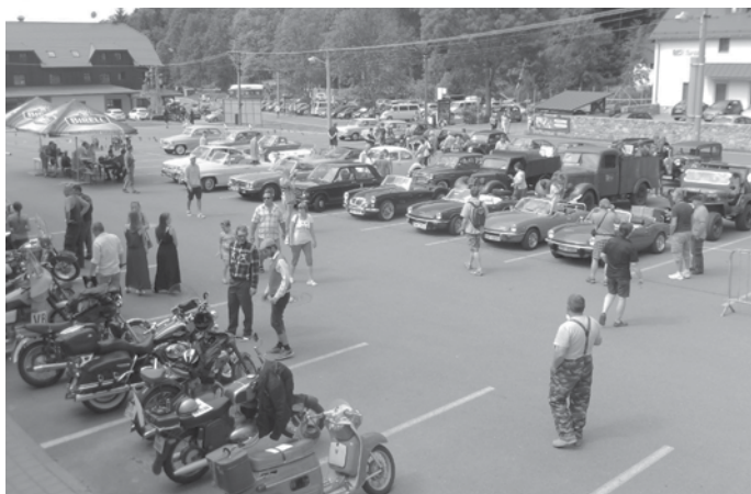
Dne 2. července 2016 se skupina členů našeho klubu zúčastnila 3. Veterán srazu v Dolní Moravě, který se konal v rámci tradiční, mototuristy z celé ČR oblíbené, akce Den plný zážitků.