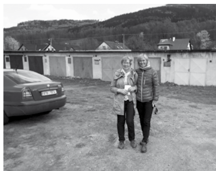
Místo, kde starší paní bydlela