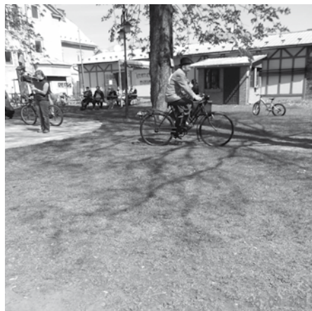
Nejstarším účastníkem byl nestárnoucí Karel Chmelař v dobovém oblečení pojišťovacího agenta z třicátých let 20. století a na kole z tohoto období.