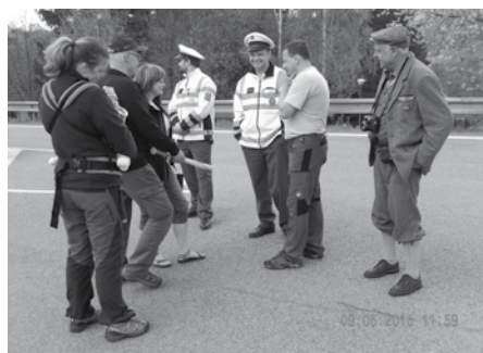
Organizátoři soutěže spolupracovali s dopravní policií.