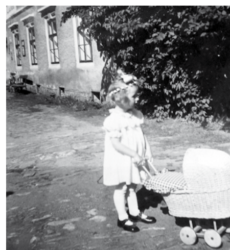
Před svým domem v České Vsi