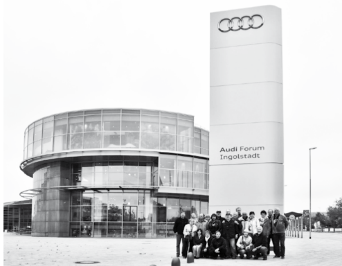
Zájezd Auto-moto veterán klubu Česká Ves do Bambergu, Ingolstadtu a Norimberku v Německu se konal ve dnech 8.–11. října 2015. Účastníci zájezdu před objektem muzea AUDI v Ingolstadtu.