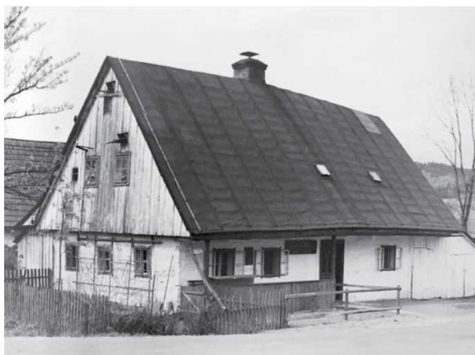
Obr. č. 1 – První školní budova v České Vsi

Školní světnice byla velmi prostě zařízena a měla lavice bez opěradla a bez desky na psaní. Žáci drželi břídicové tabulky na kolenou. Během vyučování obstarávala učitelova žena své domácí povinnosti „vaření a předení“ ve školních prostorách.