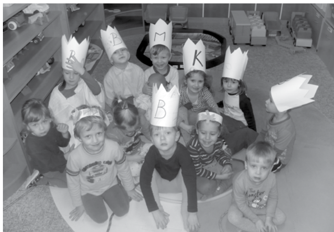
Tři králové ve školce