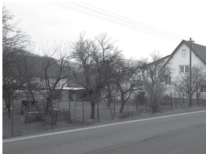
Obr. č. 2 – Nynější místo první školní budovy

Jeho roční příjmy činily podle výkazu (soupisu) z 11. října 1831 za 231 školou povinných žáků během 11 měsíců na školním platu 67 fl. (1 fl.-florin = 60 krejcarů, nyní 1 fl. = cca 120,- Kč), na náhradách platu a příspěvcích z c. k.