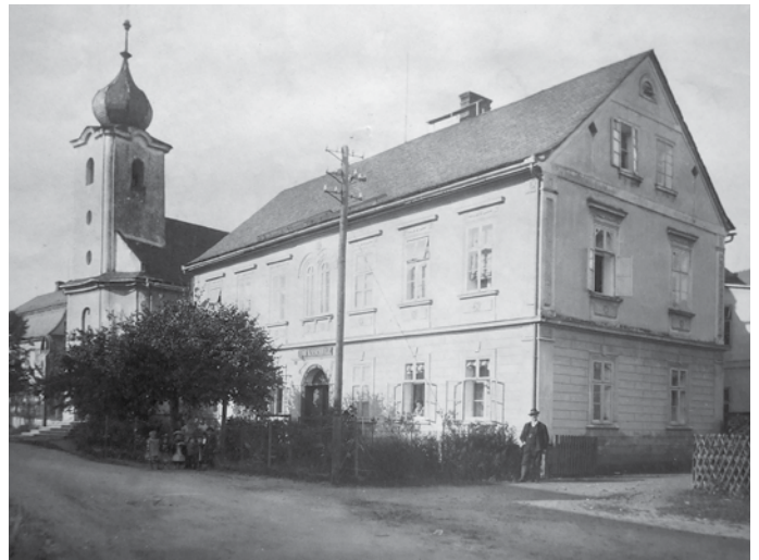
Obr. č. 3 – Národní škola v České Vsi s kaplí (snímek Rudolf Franke z r. 1909)

Během tohoto roku bude postupně tento článek rozšiřován vč. fotografií, nákresů a plánů a vložen na stránky: http://www.ceska-ves.estranky.cz/ .