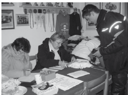
Prezentace soutěžících probíhala v suchu