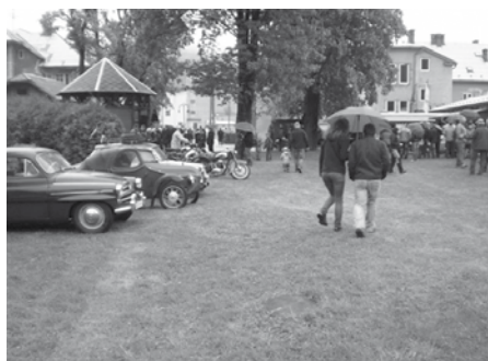
Nepřízeň počasí, déšť, vítr, mlha a zima pronásledovala i letošní ročník a negativně ovlivnila počet účastníků