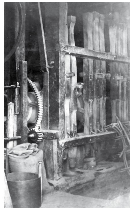
Zařízení stoupy na hospodářství č. 176