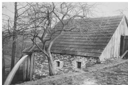
Malý obilný mlýn na hospodářství č. 176