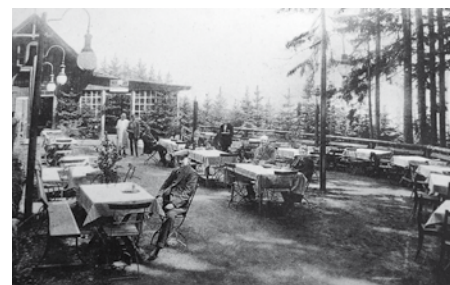
„Restaurace Lesní klid“ – pohlednice