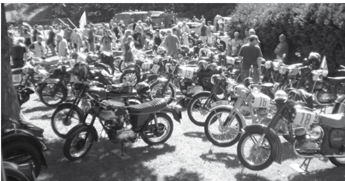
Pastva pro oči fanů: Výstava 50ti historických motocyklů a 40ti historických automobilů v prostorách našeho Veterán muzea před započetím soutěže. Podrobnější informace najdete na stránkách JT č. 33