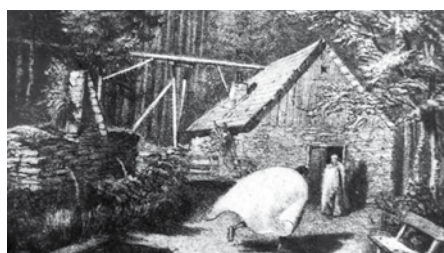
Zbytky někdejší „Pánské sprchy“