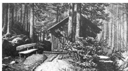
„Dámská sprcha“ u dnešního Žofiina pramene v době Vinzenze Priessnitze