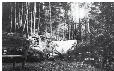
Adolfův, Flořin a Adélin pramen – „Pánská sprcha“ v době Vinzenze Priessnitze

Jak je zřejmé z náčrtku plánu, zahrnuje oblast pramenů Priessnitzova potoka 11 dosud ještě existujících pramenů a dnes už zasypaný pramen „Flora“. Z výše jmenovaných 11 pramenů má 9 jednoduchou kamennou desku s označením (z toho 8 s rokem vybudování), Pruský (Bezručův) pra-