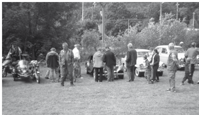
V Sobotíně prokázali myslivci, že nejen les, ale i auto-moto veteráni je dokáží uchvátit.