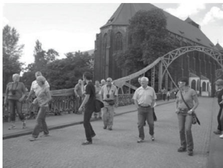
Součástí zájezdu byla i účast na mši s následnou prohlídkou kostela a dalších pamětihodností města Wrocław