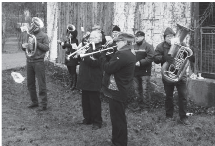
Oškerovci hráli koledy