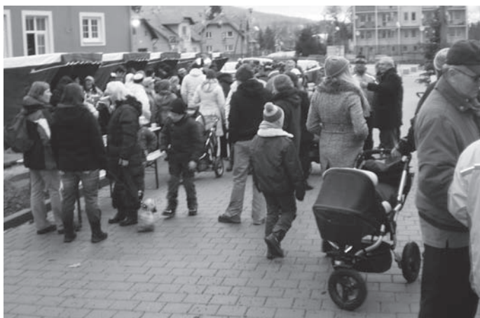
Účast občanů byla lepší než jindy