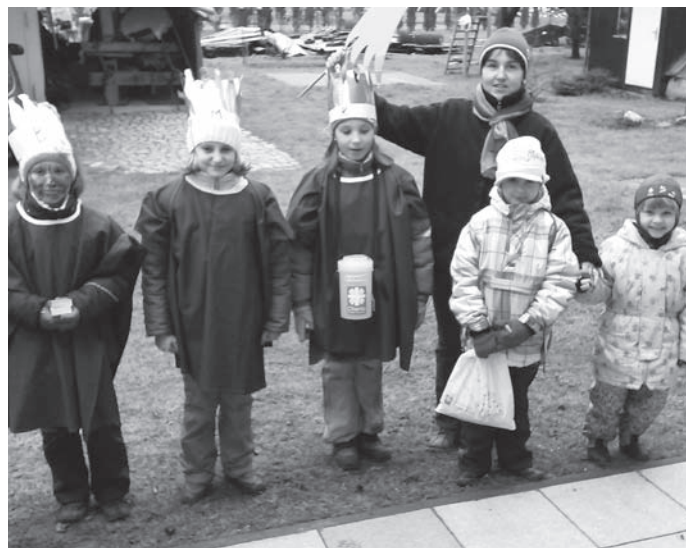
Účast občanů byla lepší než jindy

Vaše dary budou využity z velké části na zkvalitnění péče o seniory – budou provedeny úpravy sociálních zařízení v DPS sv. Hedviky ve Vidnavě. Pán Bůh zaplat' za Vaše dary, jak říkáme my křesťané.