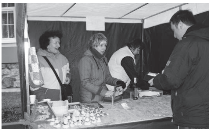
Nabídka ozdob i zahřátí