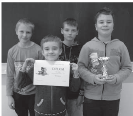
1. – 5. třída, vítězné družstvo Česká Ves