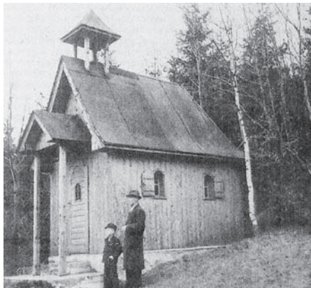
Historické foto kostelíku

Obyvatelé České Vsi to nikdy neměli jednoduché. Dřeli se, aby užívali své rodiny. Ani v dobách, kdy se obcí valila velká voda, slunce spálilo úrodu na prach, nebo když obec sevřel příkrov nezvykle tuhé zimy, si lidé našli čas k pobavení. V okolních lesích se před druhou světovou válkou nacházelo okolo 20 chat. Mezi ty známější patřily například Schlesinger-Baude, Peter-Baude, Vinzenz-Baude a mnohé jiné.