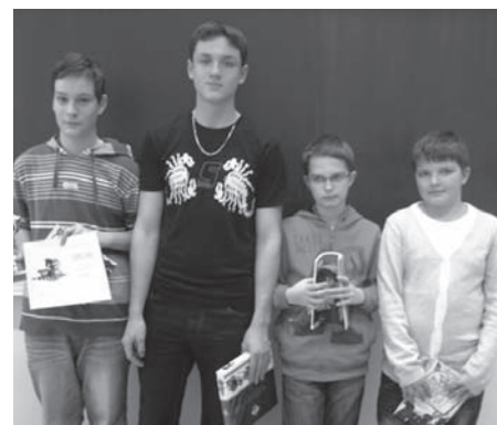
6. – 9. třída, vítězné družstvo Česká Ves