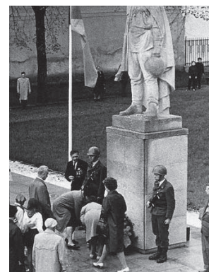
Pomník sloužil řadu let jako pietní místo