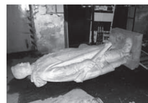
Dehonestace všeho Ruského po roce 89. Současný stav pomníku.