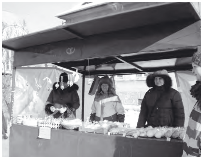
I stánkaři mrzli.