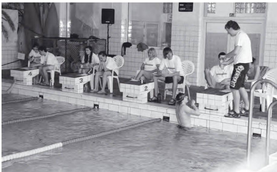
Rozhodčí, kteří sledovali počet odplavaných metrů, naplavali také několik kilometrů.