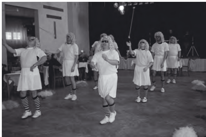
Mužoretky z Písečné se líbily.