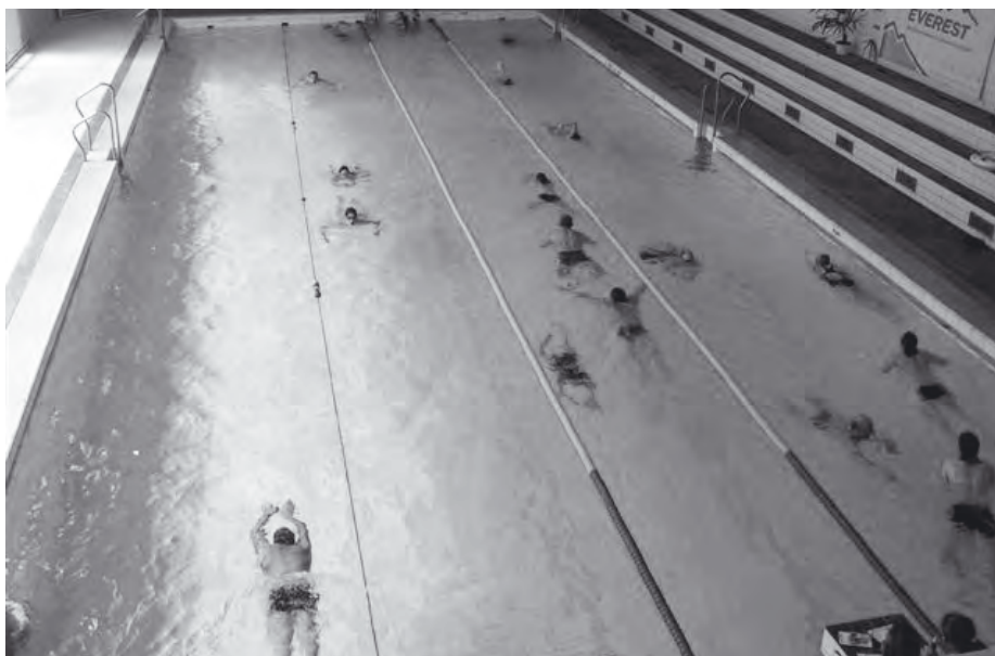
Účastníci již plavkou k Dunaji.