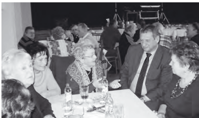
Družná diskuze i s vedoucími podniku.