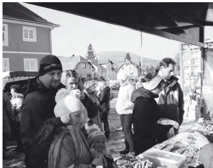
Největší poptávka byla po svařáku.