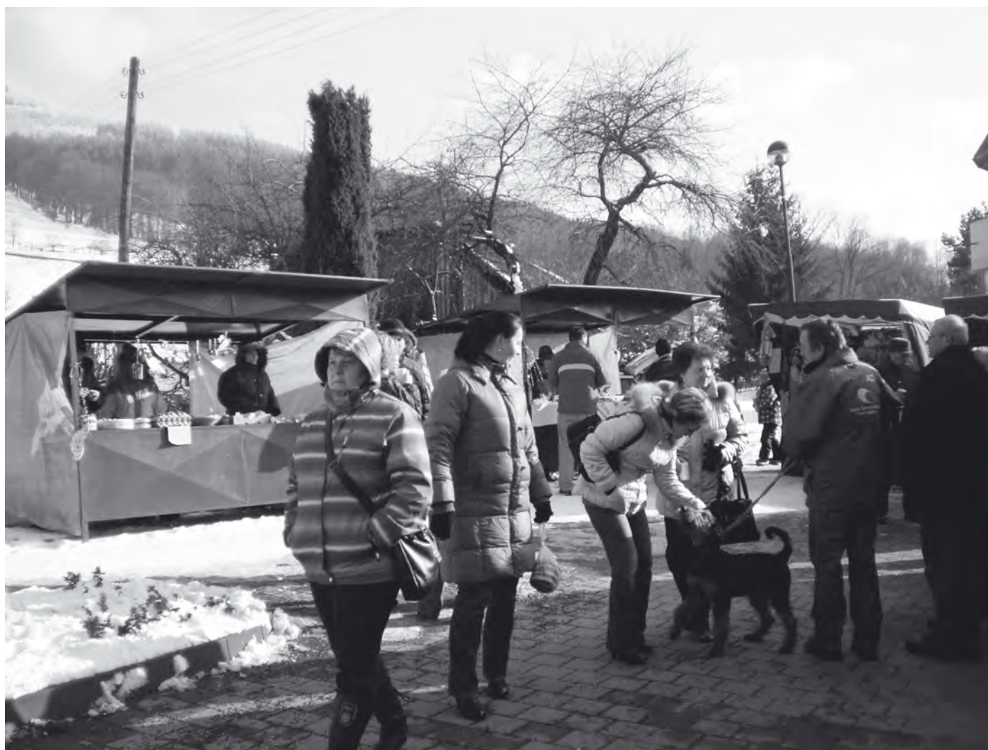
Zima a žádná pohoda.