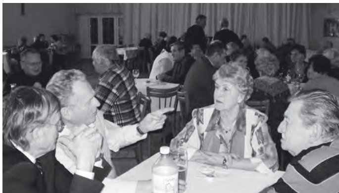
Stále je se o čem bavit.

Vystoupil také předseda Odborového svazu, a s velkým zájmem si všichni vyslechli zprávu o stavu akciové společnosti, kterou přednesl gen. ředitel Dr. Gorol. Některé údaje z ní rozhodně budou zajímat i naše čtenáře. Tak na příklad v uplynulém roce se zvýšila výroba o 5% a tržby vzrostly o cca 10%. K tomu také úměrně stoupl počet zaměstnanců. Vyráběné řetězy jsou na špičkové světové úrovni a přes 80% výroby se exportuje, hlavně do Německa, Polska, Norska a Anglie. Průměrný meziroční růst platů činil kolem 1tis.Kč. Jistě to jsou zajímavé výsledky a nezbyvá než popřát společnosti, aby jich dosahovala i nadále. Všichni účastníci děkují organizátorům – výboru Klubu - za uspořádání tohoto setkání a oceňují i jejich celoroční aktivitu a obětavost. Díky také v neposlední řadě patří sponzorům i soukromým dárcům za bohatou tombolu.