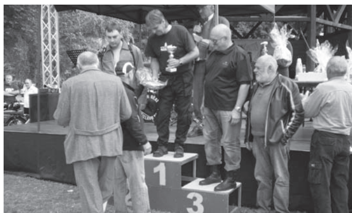
Vyhlášení vítězů v soutěži historických motocyklů