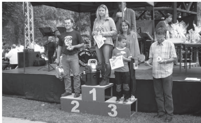
Vyhlášení vítězů v soutěži historických automobilů