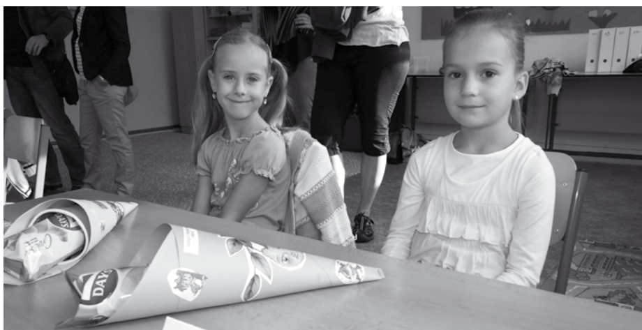
Děti z „přípravy“