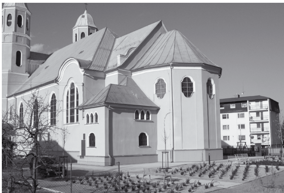
Kostel sv. Josefa v České Vsi

V letošním roce nebudou rozesílány osobní pozvánky. Tímto zveme všechny naše seniory!