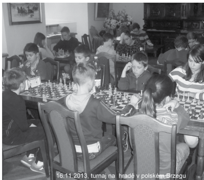
16.11.2013, turnaj na hradě v polském Brzegu