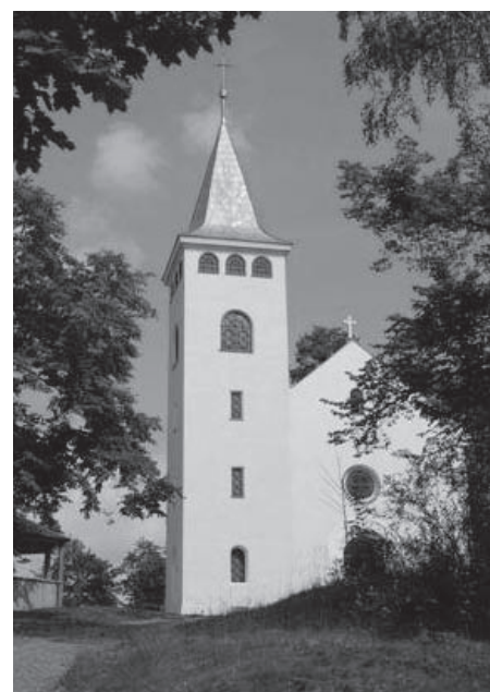
Shora: hasičské auto, hasičská zbrojnice, radnice, Křížový vrch Vlevo: společné foto