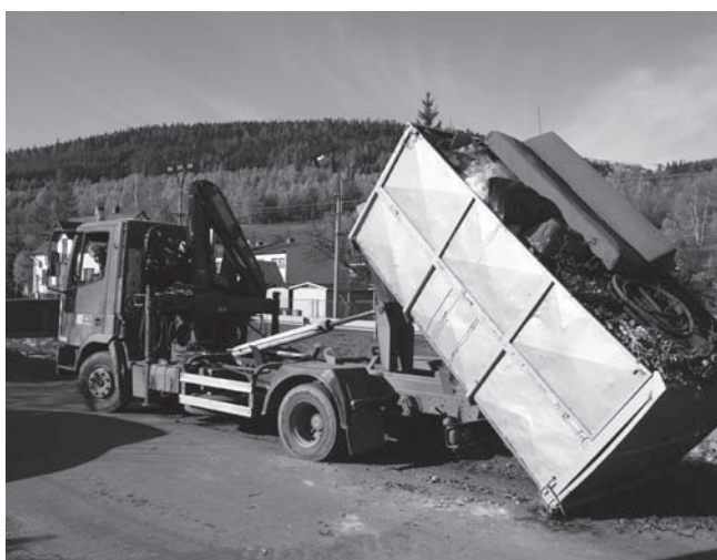
Svoz objemného odpadu