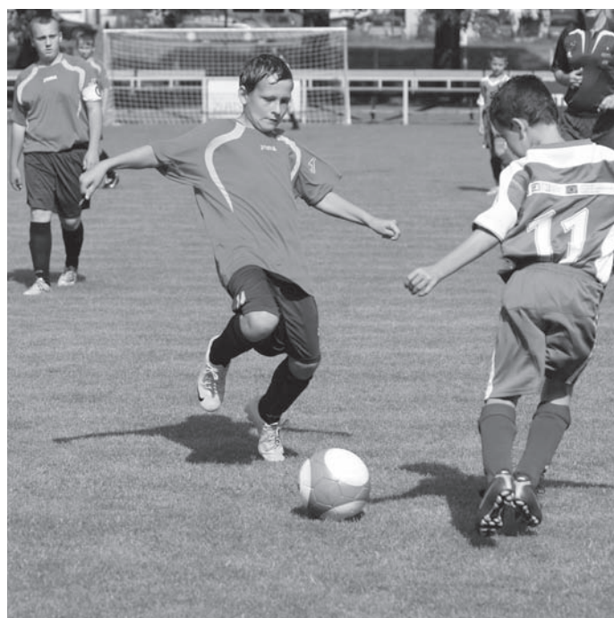
žáci v akci