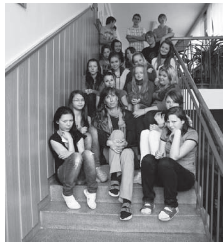
Nahoře: autoři vernisáže Vlevo: ukázka vystaveného díla