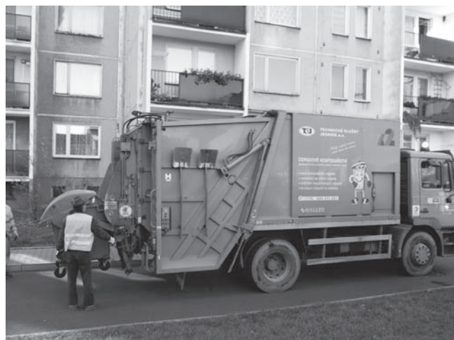
Svoz domovního odpadu