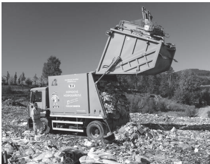
Výsyp odpaů z popelnic a kontejnerů na skládce odpaů

stavebních pracích. I tady se odpad dále dělí podle materiálu – beton, cihly, keramika, různé zdící materiály, obaly od stavebních hmot, dřevo, materiály s obsahem azbestu (např. eternit), zemina a kamení z výkopů a jiné. Odpady se ukládají především na řízenou skládku odpaů. Některé zdící materiály se mohou převzít na drcení a recyklaci a pak