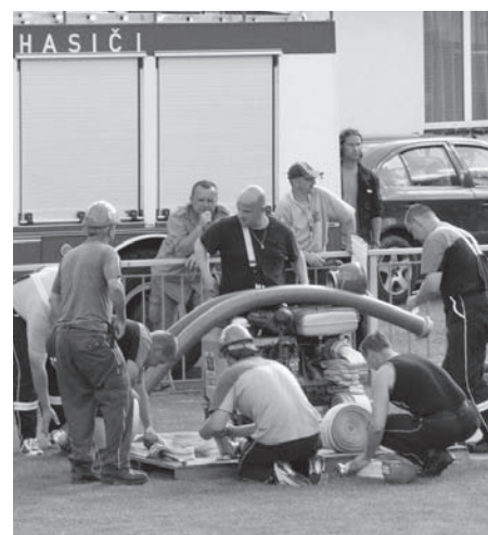
SDH ČESKÁ VES

Poděkování patří také Olomouckému kraji za příspěvek na uskutečnění této soutěže.