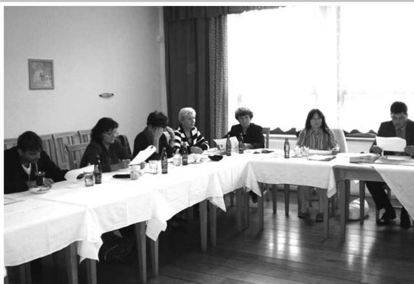
Jednání bylo věcné