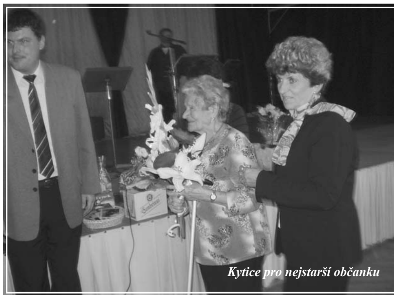
Kytice pro nejstarší občanku

Za vydařenou akci patří jistě dík obětavým organizátorům (- torkám) z řad Osvětové besedy a sponzorům – místních podnikatelů i soukromých osob, kteří dotovali ceny do tomboly.