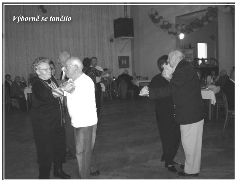
Výborně se tančilo