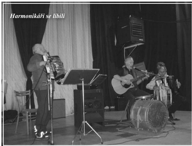
Harmonikáři se líbili