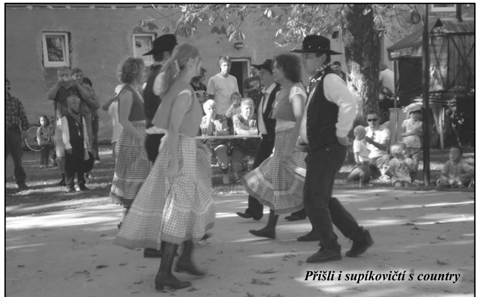
Přišli i supíkovičtí s country