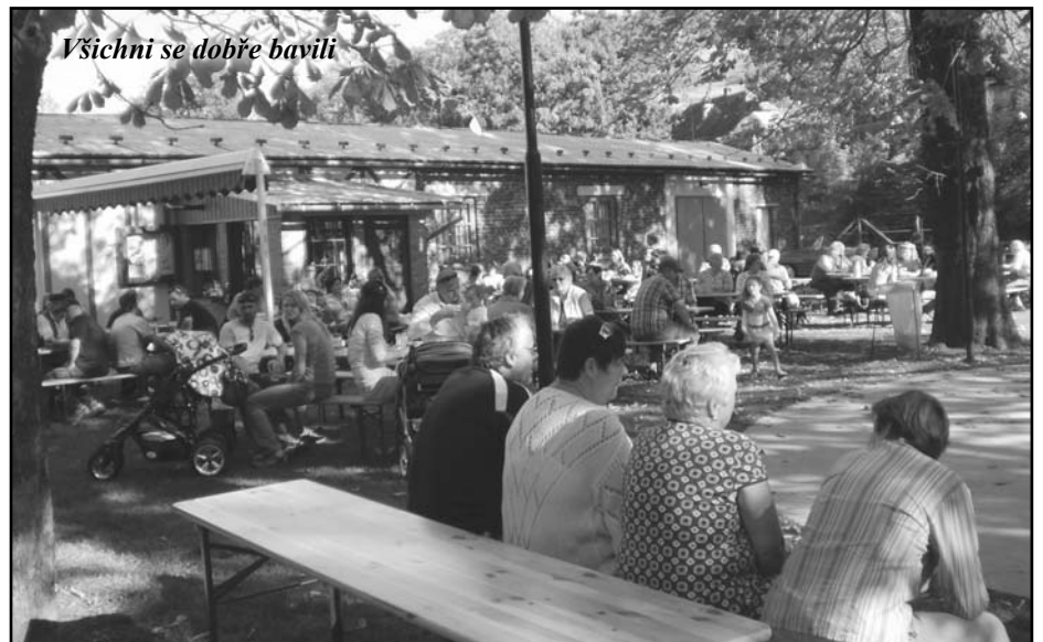
Všichni se dobře bavili

P o z v á n k a Zveme Vás na slavnostní ukončení realizace investiční akce „REVITALIZACE OKOLÍ KOSTELA