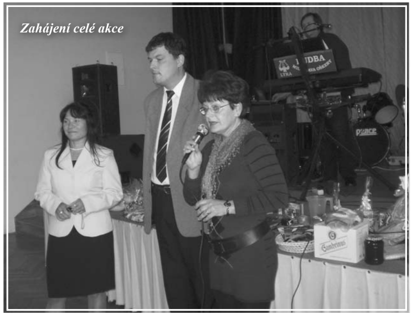
Zahájení celé akce

Na letošní setkání dne 20. října přišlo sálu hotelu Zlatý Chlum kolem 120-ti občanů, ze zhruba tří stovek pozvaných. (Zvou se všichni občané nad 65 let).