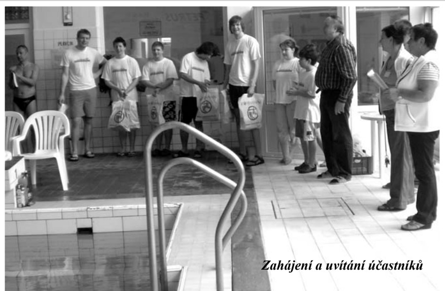
Zahájení a uvítání účastníků