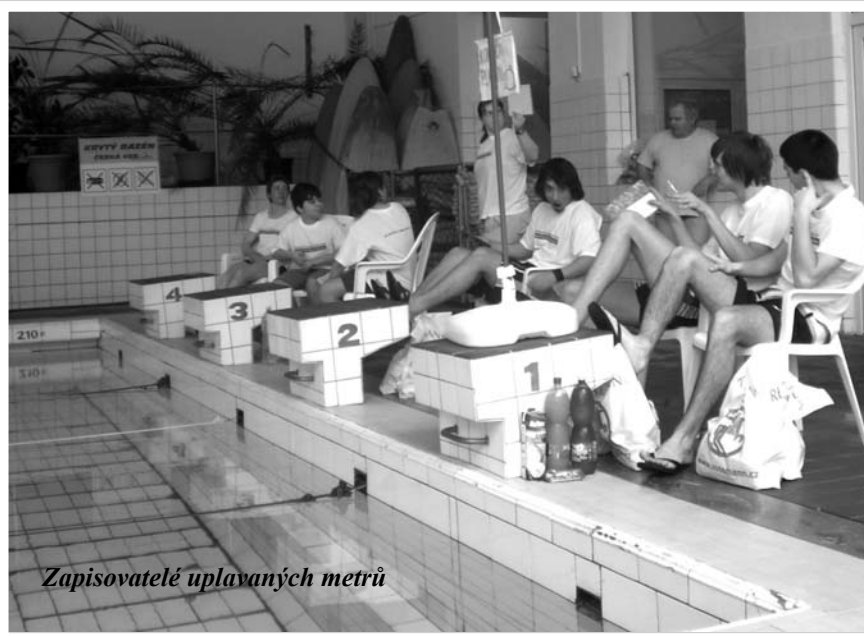
Zapisovatelé uplavaných metrů

K moři zbývá pořadatelům ještě 1 944 km, možná by stálo za zvážení vyhlásit celoroční, víceletou, plaveckou soutěž škol pro MŠ, ZŠ a Střední školy o putovní poháry starostů České Vsi, Jeseníku, firem a otočit to od pramene Dunaje k moři několikrát.