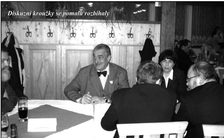
Diskuzní kroužky se pomalou rozbíhaly

Protože všichni přítomní věděli, že Karel Schwarzenberg je předsedou nové pol. strany TOP 09, očekávali na úvod nějaký projev o programu této strany atd. Hluboce se ale mylili. Členka doprovodu hostů jejich jménem uvítala přítomné, požádala je,