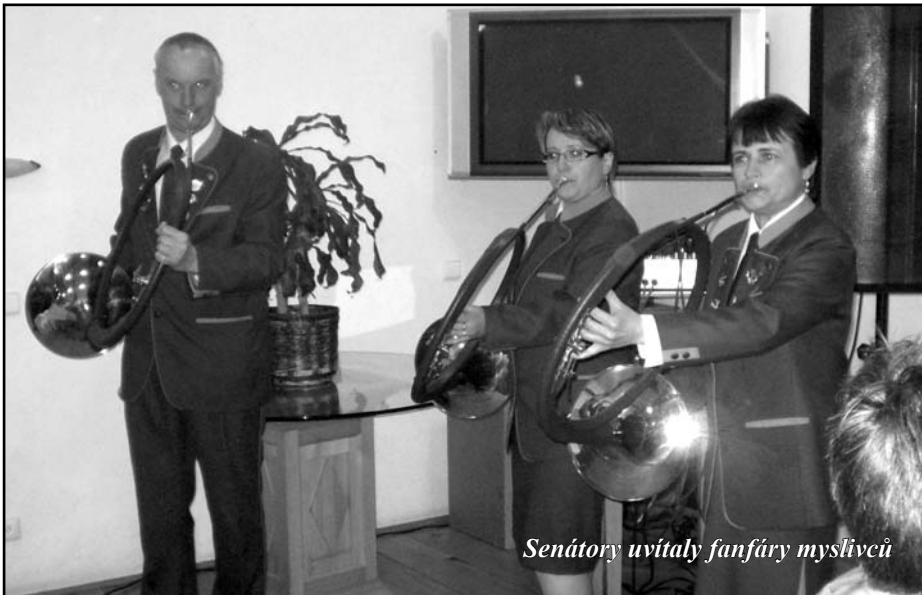
Senátoři uvítaly fanfáry myslivců