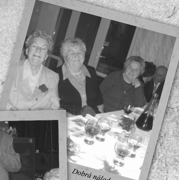
Dobrá nálada u stolů