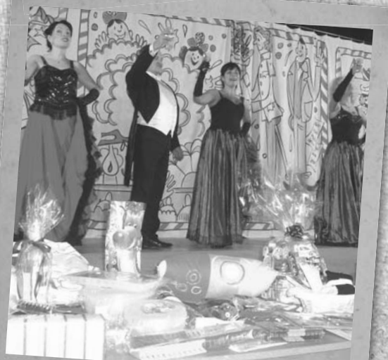
Soubor z Opavské opery a tombola