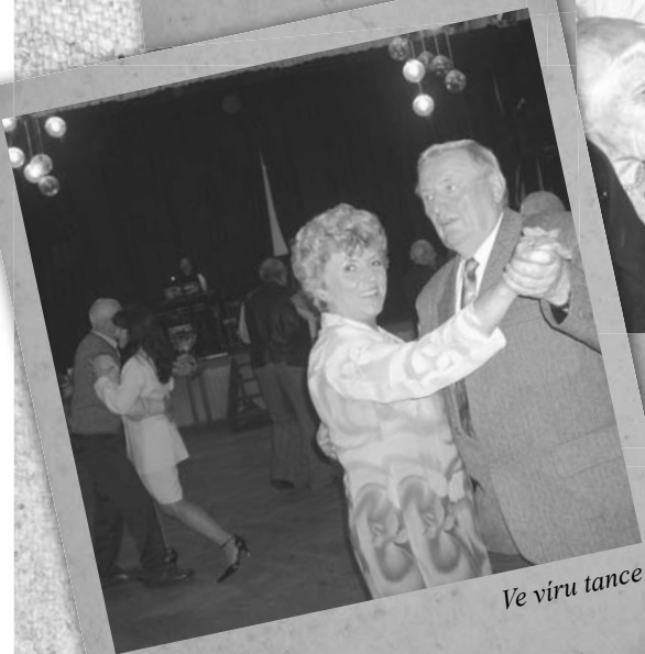
Ve víru tance