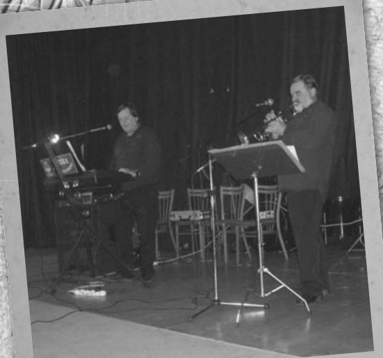
K tanci a poslechu hráli Oškerovci

Dne 8. října bylo ve velkém sálu hotelu Zlatý Chlum opět veselo. Sice se oproti loňsku dostavilo méně občanů – nikdo neví proč, ale na dobré náladě to určitě nikomu neubralo. U stolů se při dobrém vínu a výborném guláši probíraly se sousedy a přáteli všemožné zajímavosti, jak už to mezi vrstevníky a pamětníky bývá. Změna k dobrému byla ve zpestření programu skupinou umělců a hlavně zpěvaček z Opavské opery ND. Za doprovodu kláves zazněly známé i méně známé arie z oper a operet, občas zpestřené historkami z divadelního zákulisí. Po programu rozbalili nástroje naši Oškerovci a parket se zaplnil tanečními dvojicemi. Mezi tím se tahaly z klobouku losy bohaté tomboly, sponzorované místními podnikateli i jednotlivými občany.