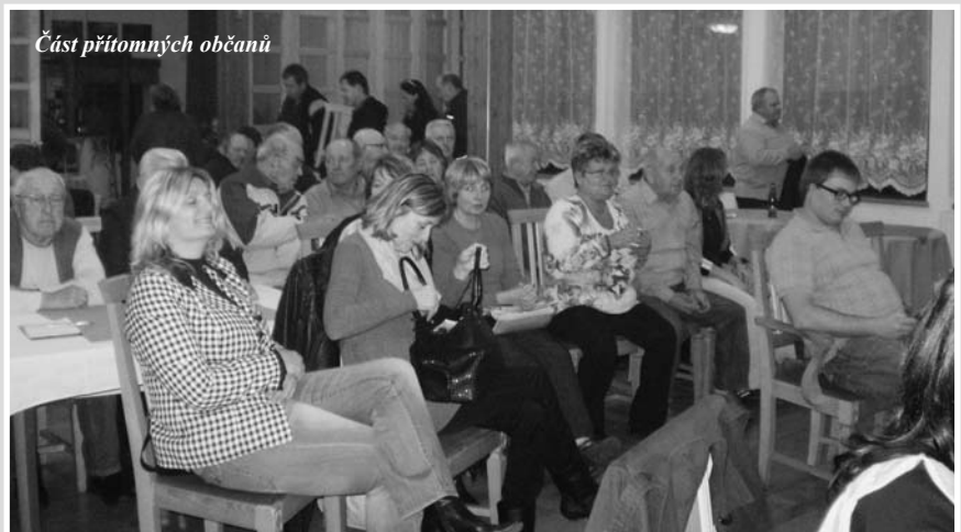
Část přítomných občanů