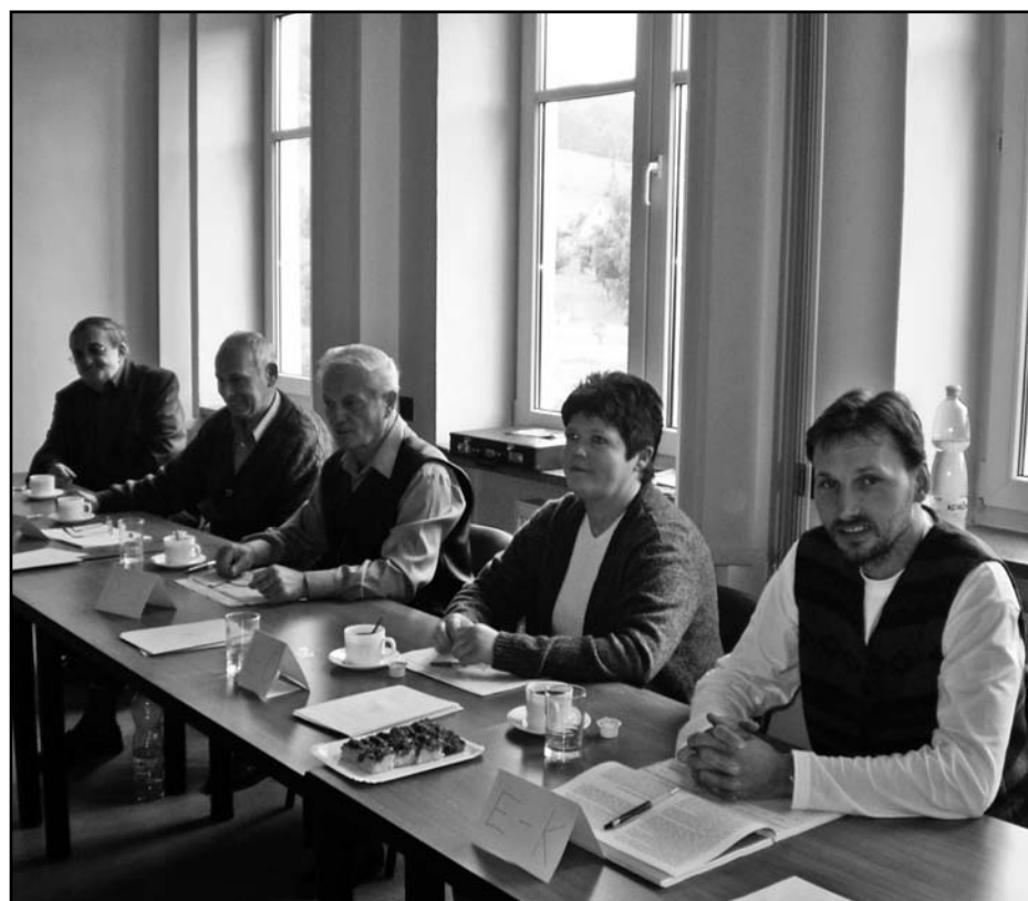
Volební komise měly tentokrát pohodu