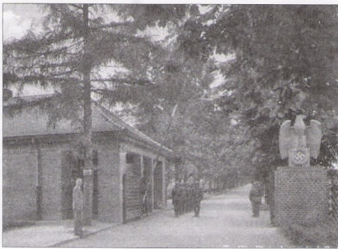
„Pohlednice hlavní brány tzv. Britenlager (Stammlager VIII B/344 Lamsdorf), s datem poštovního razítka 15. 11. 1944.“