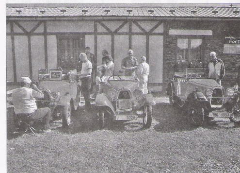
„Aerovky na srazu veteránů“

nová, typu GASALONE 28, stála kolem 1,3mil.Kč a má solidní vybavení i pro zimní údržbu.