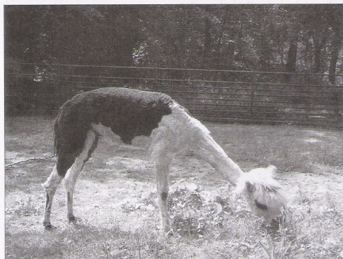
Stanislav Derlich oddělení pro kontakt s veřejností Zoo Ostrava