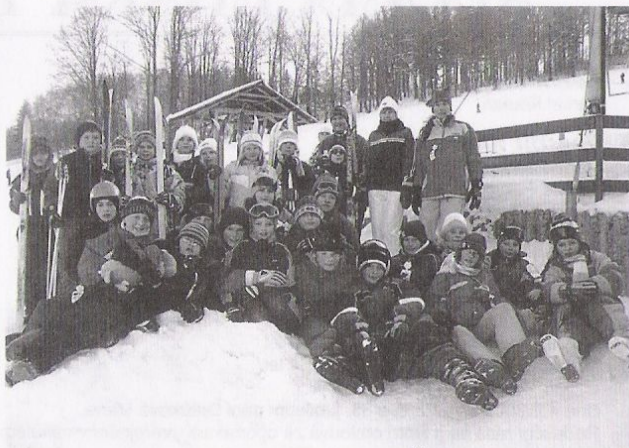
Lyžařské kursy mají na naší škole svou tradici. Žáci 5. a 7. ročníků prožili krásné dny na zasněžených pláních. Více se dozvíte v dalším čísle zpravodaje

jsme byli jednu zimu tak „odříznuti“ od světa, že tři dny nebyla pošta ani noviny. Dnes je technika sice na jiné úrovni než tehdy, ale udržení sjízdnosti cest a schůdnosti chodníků si také žádá jiné náklady. Každopádně jsme na přírodu stále krátcí, i když oproti jiným katastrofám ve světě to je u nás pohoda.