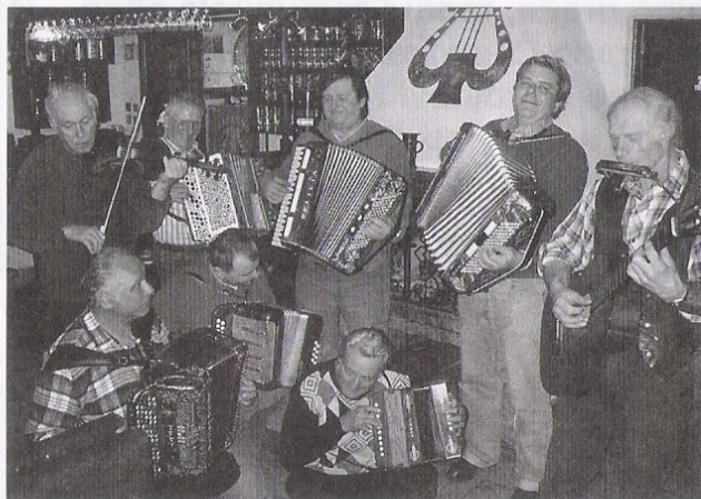
Harmonikáři v Lyře