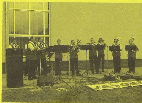
Javořinka při produkci