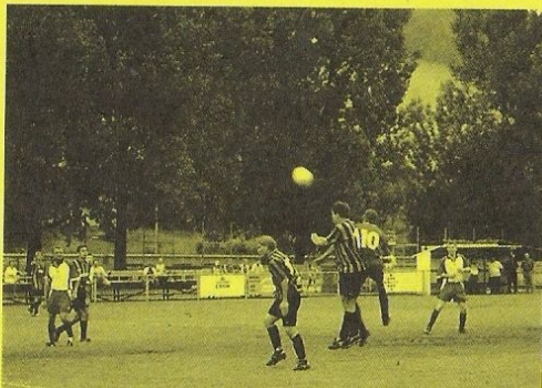
Č. Ves v akci

Turnaj sledovalo 350 diváků. I přes těžký podmáčený terén a bouřku i silný déšť v průběhu druhého poločasu prvního utkání se turnaj vydařil, hráči předváděli na těžkém terénu ve všech zápasech dobrý a útočný fotbal a také střelecky se v utkáních dařilo. Všechna mužstva obdržela kromě krásných pohárů také hodnotné věcné ceny.