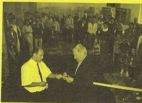
Okamžik stříhání pásky

přijeli se k nám jen pobavit – zatím pobavili více oni nás perfektním přednesem lidových i klasických písní.