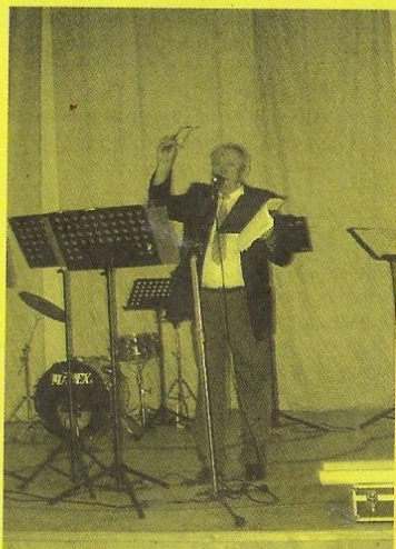
Osobitý projev starosty

Dne 8. července se uskutečnilo konečně jeho slavnostní otevření. Zúčastnila se nejen řada pozvaných hostů, ale i značný počet občanů naší obce, kteří byli zvědaví, co se zde všechno změnilo.