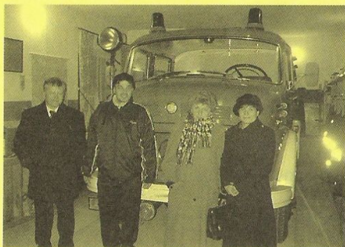
Návštěva hasičské zbrojnice v polské České Vsi

byl také spontánní zpěv koled přítomných občanů s mladými herci. Potom následovalo besedování v otevřeném, srdečném duchu, diskuse s partnery podle zájmů, profesí, sdělování zkušeností, zodpovídání dotazů, hledání možností konkrétních styků atd. až do pozdních večerních hodin. Třeba přiznat, že to vše bylo při dobrém jídle a pití – ale se vši slušností a důstojností z obou stran.