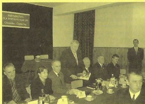
Projev našeho starosty

radnicí v Olszance, všestranná péče o nás po celou dobu pobytu, záplava informací a poznatků – to byly tak hlavní znaky návštěvy. Při uvítání a kávě na radnici jsme také obdrželi 10ti stránkovou výpravně zpracovanou publikaci ve formě prezentace obou našich obcí (polsky, česky, anglicky) a upřesněný program našeho pobytu. Pak jsme si prohlédli zdejší velkou, nedávno postavenou školu, ve které jsou děti od mateřinek až po gymnazisty. Nahlédli jsme i do tříd při vyučování – atmosféra zde byla stejná jako u nás. Někteří jsme zaregistrovali odlišnost v symbolech čelních stěn tříd. Místo u nás obvyklého obrazu prezidenta zde mají všude státní znak a prostý kříž s Kristem.