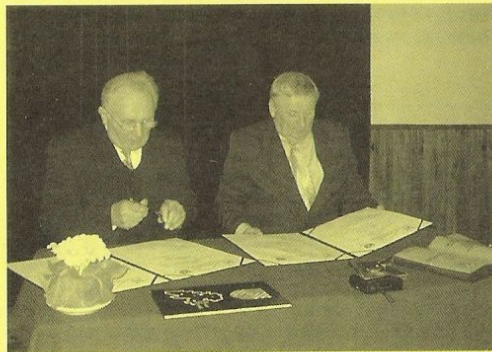
Starostové při podpisu

Teď už ale k vlastní návštěvě. Odjžděli jsme s obavami, jako že co tam budeme 2 dny dělat v chladném sychravém počasí, jak budeme přijati, jak to bude s jídlem, spaním, atd. Skutečnost ale rychle naše obavy rozptýlila. Srdečně a přátelské přijetí hned při vystoupení z autobusu před