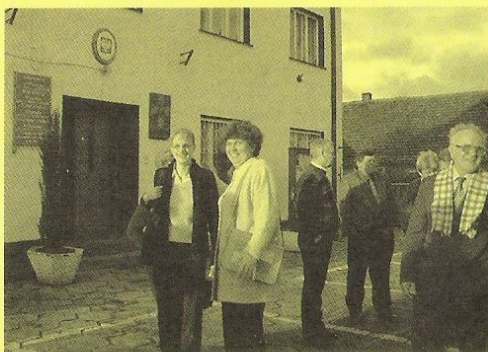
Příjezd k radnici v Olszance

počasí, jak budeme přijati, jak to bude s jídlem, spaním, atd. Skutečnost ale rychle naše obavy rozptýlila. Srdečně a přátelské přijetí hned při vystoupení z autobusu před