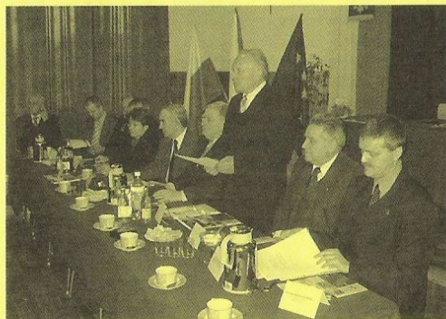
Předsednictvo slavnostního zasedání

okres (powiat) Brzeg a ten je součástí kraje (województwa) Opole. Leží uprostřed mezi městy Opole a Wrocław, ve vzdálenosti od nás asi 80km směrem na Nysu. Jednou ze spravovaných obcí je Czeska Wies, tedy obec stejného názvu jako naše. Má okolo 400 obyvatel. Původ názvu už přesně neznají – pravděpodobně ale pochází od českých osadníků, kteří zde někdy ve středověku založili své sídlo. Infrastruktura obcí je zhruba stejná jako u nás, chybí ale rozvod plynu a kanalizace se současně provádí. Odlišnost je v zaměstnávání obyvatel – drtivá většina soukromé hospodářství v zemědělství a jejich problémy se podobají našim zemědělcům, např. odbyt produktů. Nutno se zmínit ještě o jedné podobnosti s našim regionálně-historickým vývojem. Polsko totiž toto území získalo zpět pod svou svrchovanost až v r. 1945 a část německého obyvatelstva byla odsunuta. Nynější obyvatelé přišli z východní části země – hlavně z Volyňska a okolí Lvova, tedy dnešní Ukrajiny (pozn.: tento východ Polska zabrali vojenským přepadením Sověti už v říjnu r. 1939, ale podle dohody vítězných mocností jim území zůstalo i po r. 1945, tedy až dodnes. Po válce se ale mohli Poláci odstěhovat). To bychom se ale dostali k pestrým dějinám Polska vůbec a mohli vyprávět o pramenech jejich vysoké národní hrdosti, úctě ke své armádě a ke své historii.