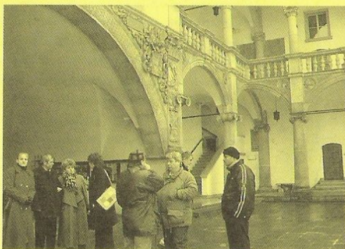
Nádvoří radnice v Brzegu

živých společných akcí. Z naší strany asi zatím panuje obava, že polská strana toho může nabídnout více než my. Možná je to jen dojem z návštěvy, ale zdá se, že u nich mají širší základnu v Dobrovolných sdruženích občanů, hlavně žen a kulturních spolků. Nelze zde taky opomenout vliv církve nejen na výchovu dětí, ale vůbec na jakési směřování občanů k větší družnosti a vzájemné solidaritě. Obecní zastupitelstvo se také zřejmě více angažuje v jejich aktivitách, respektive dokonce tyto snahy více podpořít