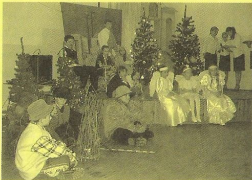
Mladí herci při vystoupení

Co říci závěrem. Snad to, že kontakty byly navázány a byla ujasněna představa o možnostech a směrech jednot-