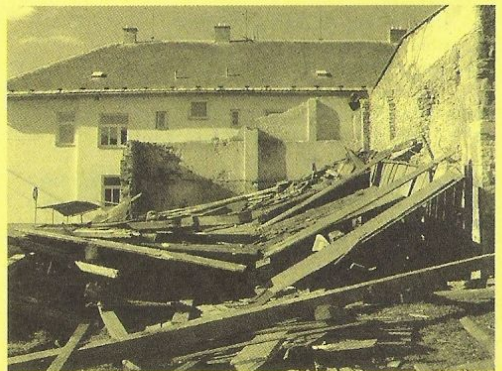
Zlepšení vzhledu obce – bourá se obecní kůlna u 28 b.j.