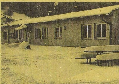
Letošní sněhová nadílka byla bohatá