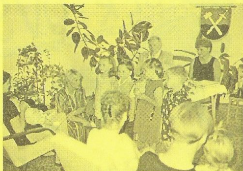
Letní fotografií se vracíme k vítání občánků (31.8.2002)