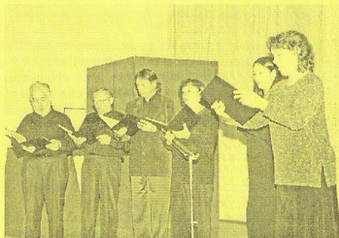
Přítomným zazpíval komorní pěvecký sbor z jeseníku