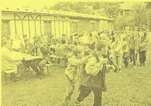
Tato fotografie se vrací k datu 14.9.2002, kdy pořádala OB v areálu Veterán-klubu Českosloveské hody