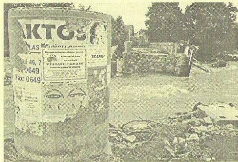
Bělá si udělala nové koryto na křižovatce „U zrcadla“

7. července je již zaplaveno téměř 80% obce. Vyhlášen III. stupeň povodňové aktivity. Říční se řeka strhla dům J. Baďury a pod řetězárnu dům pana Valici. U jatek stržen most, který byl v roce 1987 přestavěn. Silně poškozeny a vytopeny domy byly u Koukolových, Študlových, Žákových a u Zimčákových. V místní školce v Holanově ulici bylo dočasně umístěno asi 60 občanů a 30 dětí, kteří se nemohli vrátit do svých domovů. Většina obyvatel se snažila pomáhat postiženým. Ještě téhož dne bylo přistoupeno k rychlé evakuaci obyvatel. Evakuace proběhla u Štalmachových, Proseckých, Novákových, Čopjanových, Krystýnových, Frolových, Koláčkových, Reichlových, Khýrových, Valicových, Mestických, Lukešových,