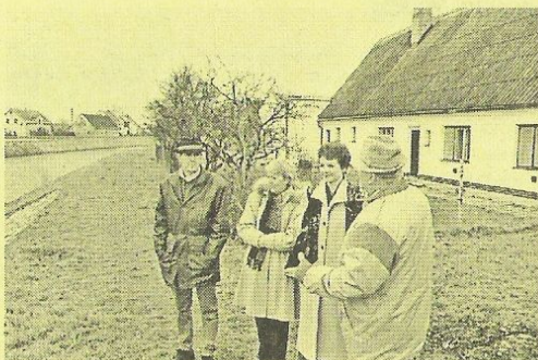
Starosta Mgr. Jindřich Jermář s delegací Městského úřadu Prahy 1.