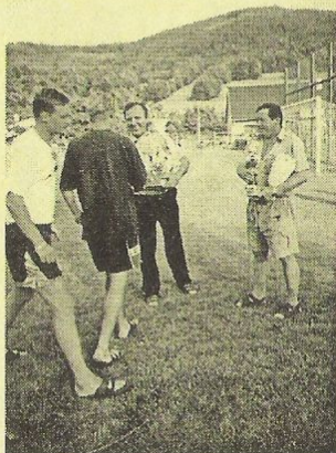
zástupci TJ předávají cenu nejlepšímu hráči turnaje