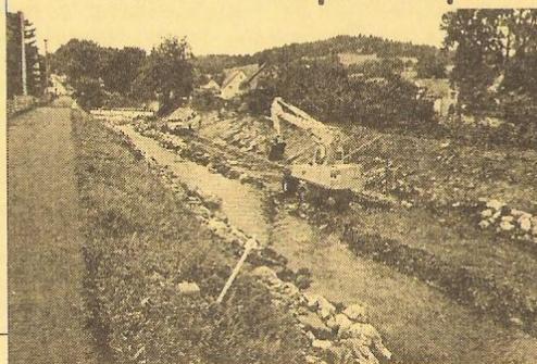
Takto nyní vypadá chovný pstruhový úsek Místní org. Čes. ryb. svazu pod ulicí K zahradnictví