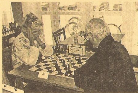
Soustředění při zápasu