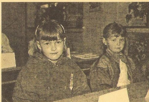
Rozařité tvářičky prvňáčků

a) podzimní – čtvrtek 26.10. a pátek 27.10.2000 b) vánoční – pátek 22.12. až úterý 2.1.2001, zahájení výuky ve středu 31.1.2001 c) pololetní – čtvrtek 1.2.2001, ukončení 1. pololetí je ve středu 31.1.2001 d) jarní – pondělí 12.3. až pátek 16.3.2001 e) velikonoční – čtvrtek 12.4. a pátek 13.4.2001 f) hlavní – pondělí 2.7. až pátek 31.8.2001, ukončení 2. pololetí je v pátek 29.6.2001