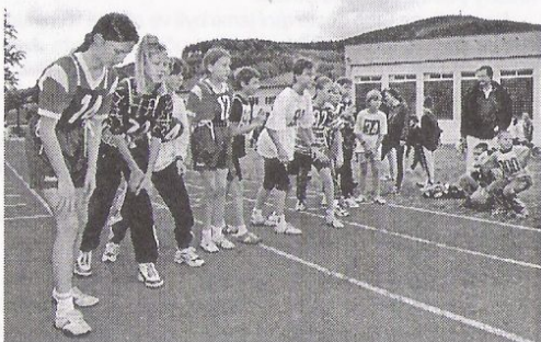
MLADÍ ZÁVODNÍCI NA STARTU