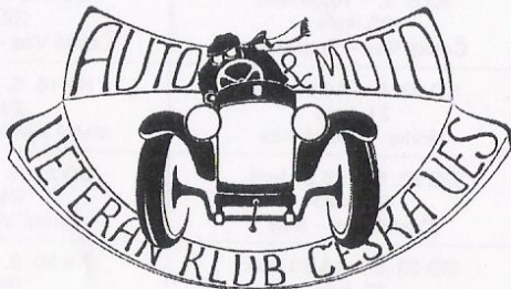
Znak AMVK Česká Ves