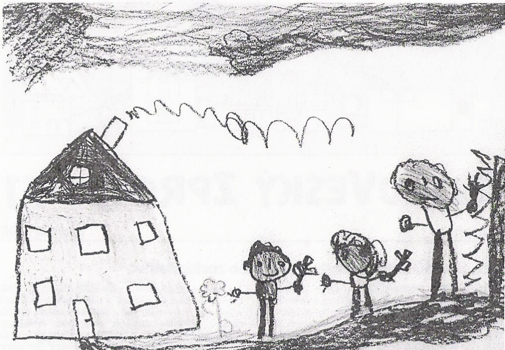
Janička Pazderová, 5 let, III. MŠ Česká Ves

ale vždy po dohodě s ředitelkou a s doporučením dětského lékaře. O školku pro své dítě mohou projevit zájem i maminky, které jsou na mateřské dovolené s mladším sourozencem.