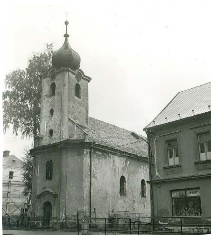
Historické foto kaple (rok 1975)