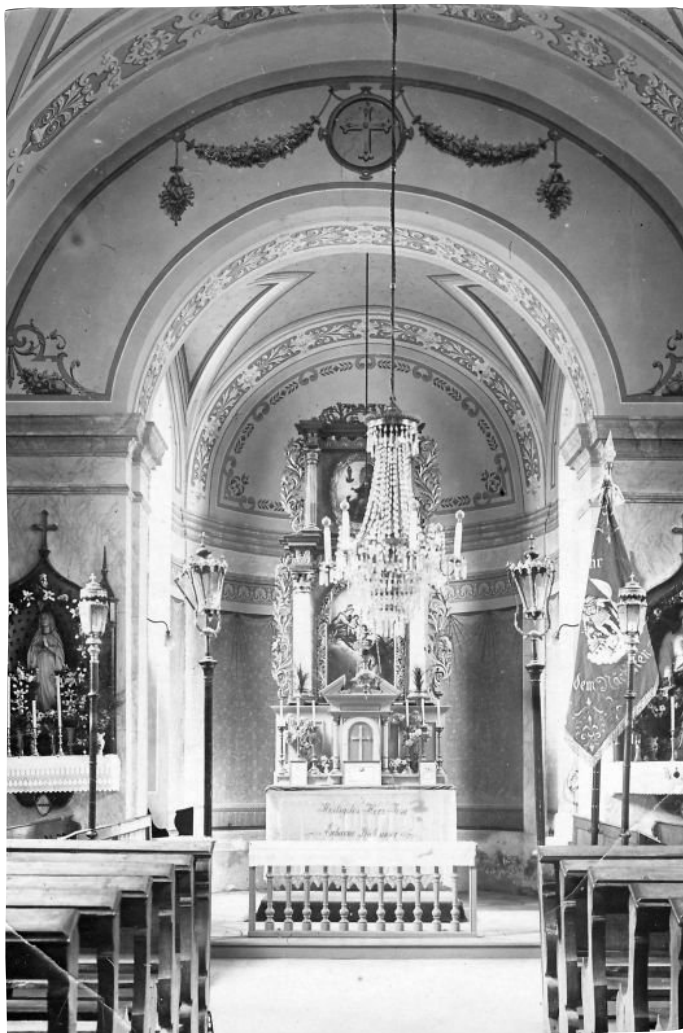
Původní interiér kaple (před rokem 1935)