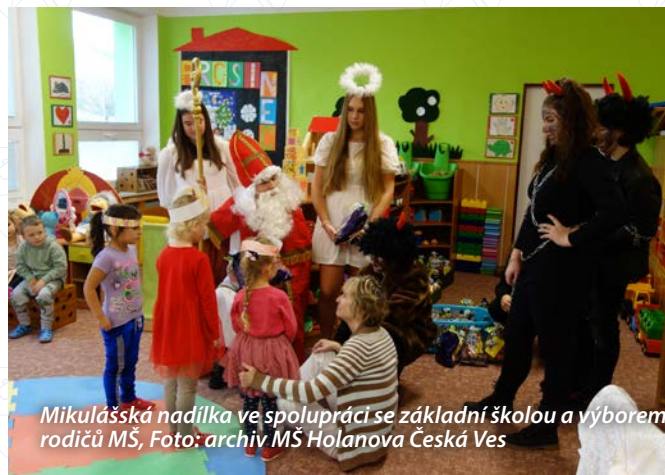
Mikulášská nadílka ve spolupráci se základní školou a výběrem rodičů MŠ