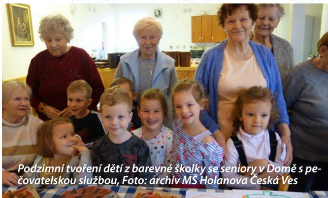
Podzimní tvoření dětí z barevné školky se seniory v Domě s pečovatelskou službou, Foto: archiv MŠ Holanova Česká Ves