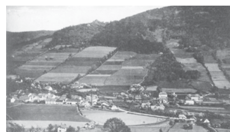
Pole byla obdělávána o mnoho výše než dnes – rok 1924