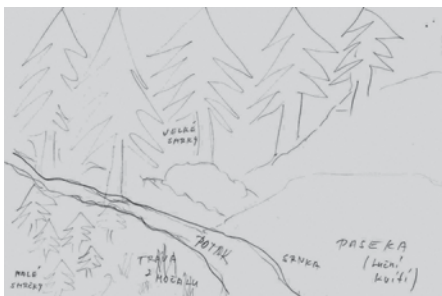
Obrázek na desce – toto zobrazení bylo na původním prameni někdy před lety