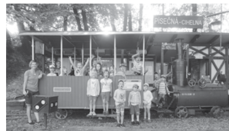
Starší děti z barevné školky na výletě v Písečné v Cihelně

Pro rodiče a jejich děti, které ještě nenavštěvují předškolní zařízení, nabízíme od měsíce října možnost docházení do našeho Klubíčka. Bude každou středu od 15 hodiny.