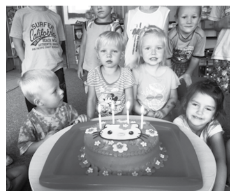
Oslavy narozenin jsou samozřejmostí a děti si je užívají