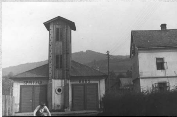
SPRITZENHAUS BÖHMISCHDORF. AUFNAHME V. F. KUTSCHERA, 1934.

č.82/II - odloučená budova se stříkačkou a věžnicí