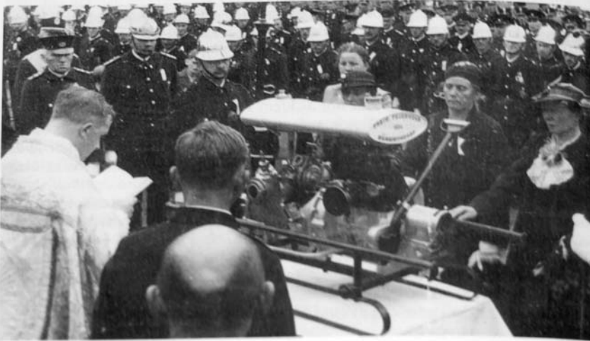
Freiwillige Feuerwehr Böhmischdorf: Weihe der neuen Motorspritze am 2. Juni 1935

2. června 1935 byla slavnostně posvěcena nová motorová stříkačka. V pozadí přihlížejí členové hasičského sboru.