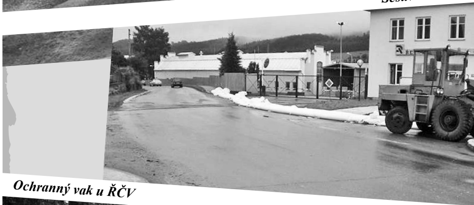
Ochranný vak u ŘČV