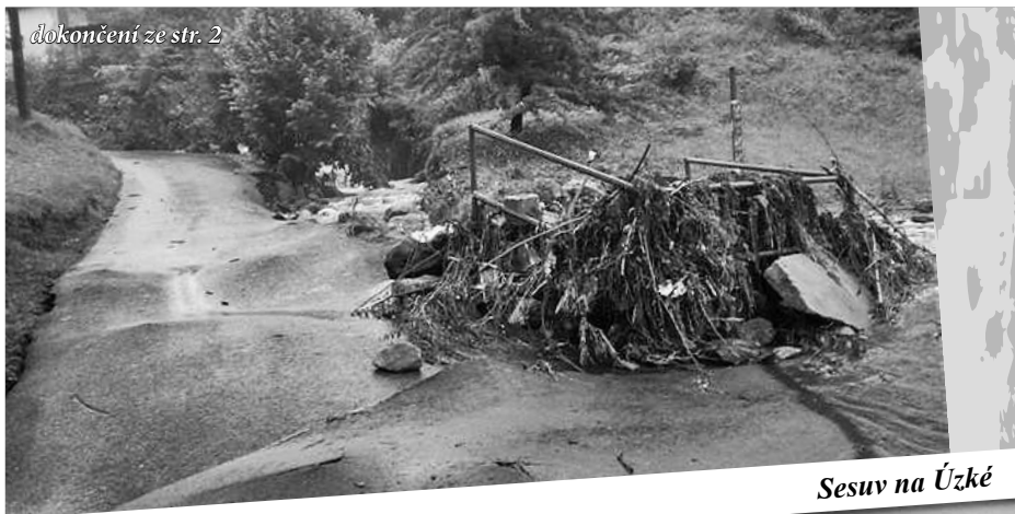
Sesuv na Úzké