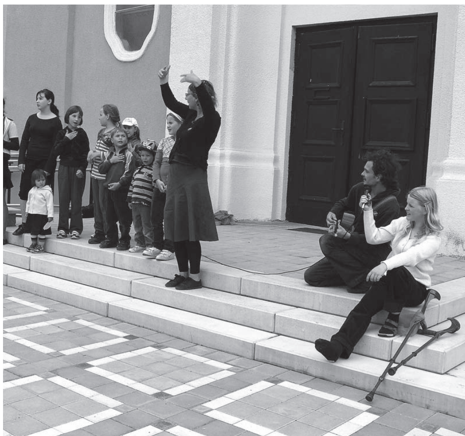
Zpívání před kostelem