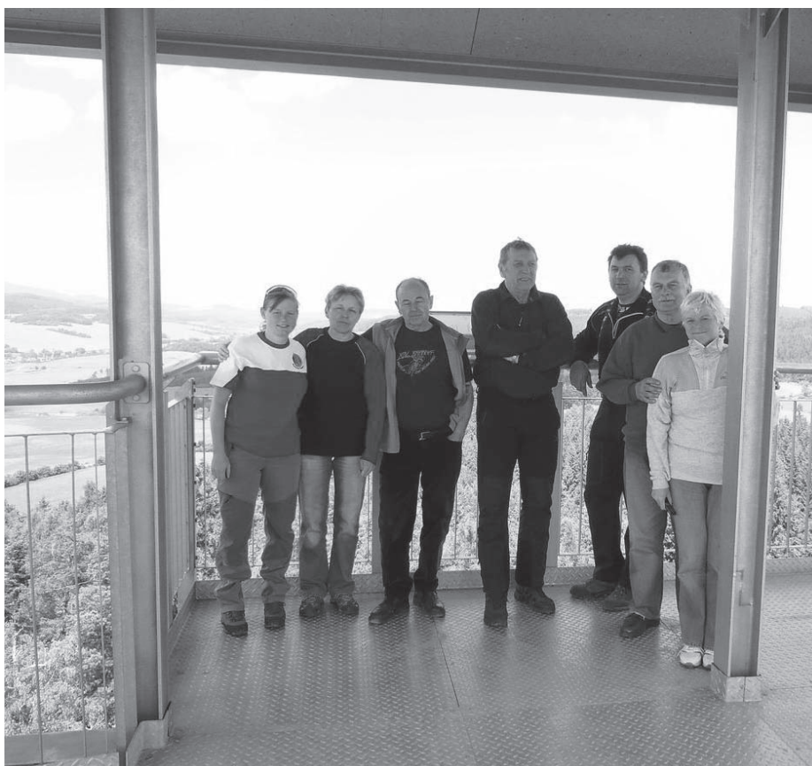
Výhled z rozhledny na Hraničním vrchu v Městě Albrechtice.