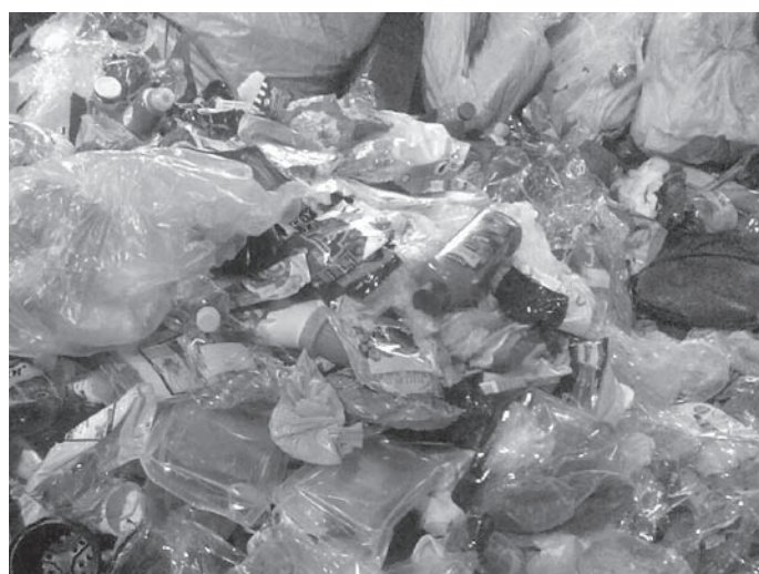
Na třídící lince