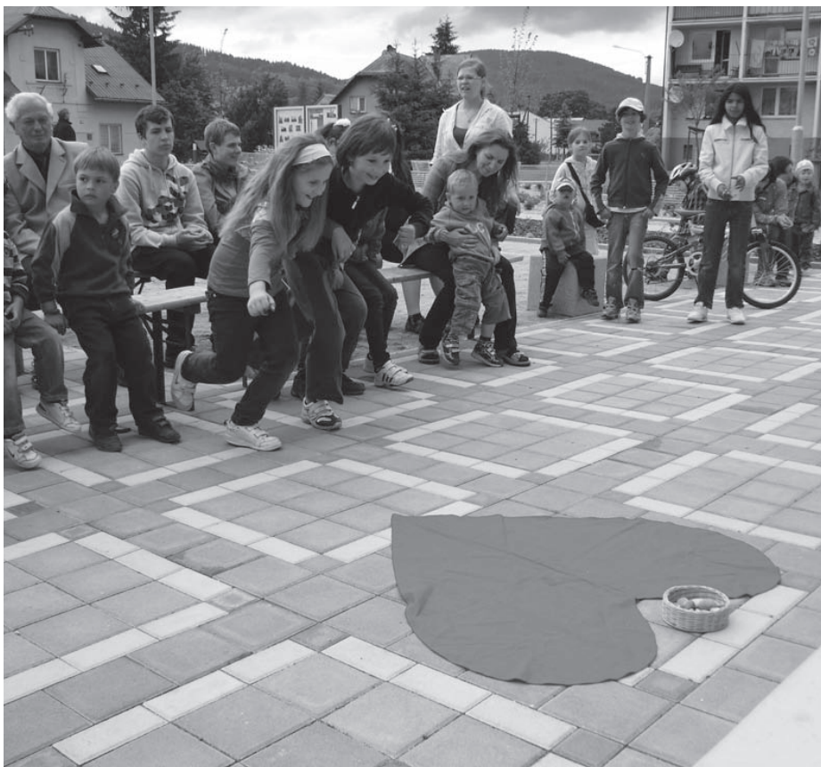
Program pro děti