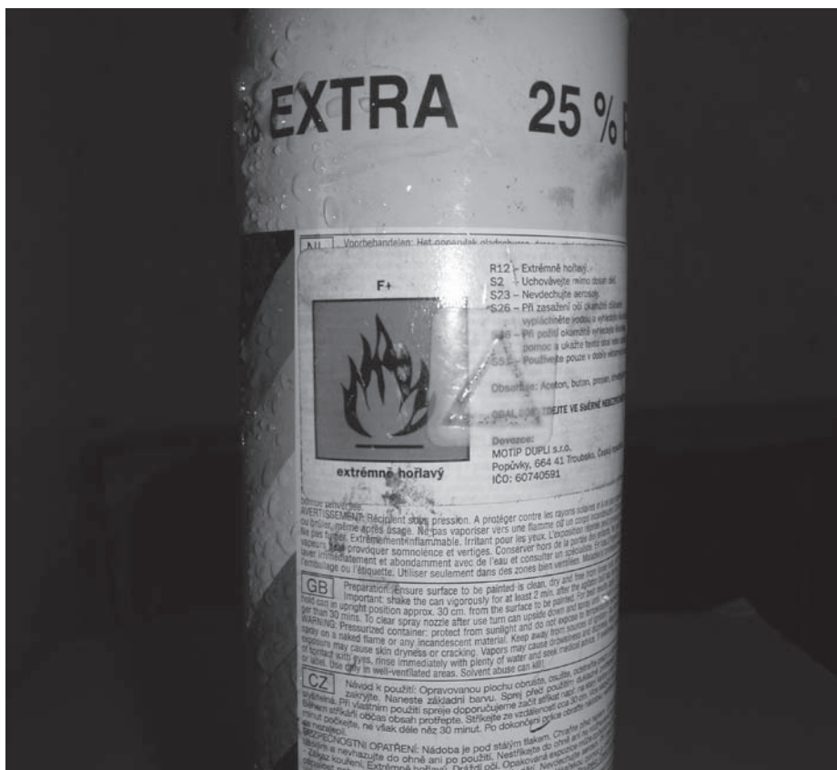
Příklad značení nebezpečného odpadu.

Mějte tyto informace na paměti, neboť jde o dost vysoké finanční částky, které by likvidace jako odpad tyto výrobky stály. Takže svým rozhodnutím – „zpětný odběr“ (zdarma) nebo „odpad“ (placeno) – výrazně rozhodnete o nákladech obce na odpadové hospodářství!