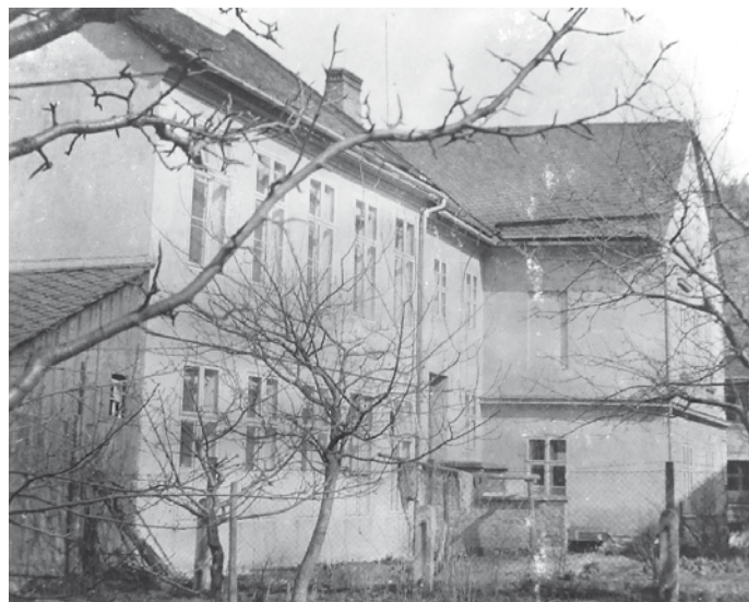
Národní škola v České Vsi – školní zahrada