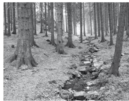
Goldflössl (Zlatá říčka)

Z kurentu přepsal Roman Janas, do češtiny přeložila Mgr. Jana Reichlová