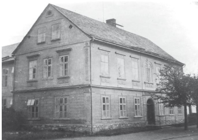
Národní škola v České Vsi

393 dětí tedy navštěvovalo obecnou školu v České Vsi, 29 žáků navštěvovalo obecnou školu v Písečné, 16 žáků veřejnou chlapeckou obecnou a občanskou školu ve Frývaldově, 7 žáků veřejnou dívčí obecnou a občanskou školu ve Frývaldově, 3 žáci soukromou dívčí občanskou školu Řádu sester ursulinek Frývaldov a 9 žáků reformní reálné gymnázium ve Frývaldově. Celkem tedy bylo 457 žáků ve školou povinném věku.