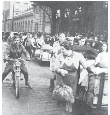
Příjezd českých uprchlíků z pohraničí před Wilsonovým nádražím v Praze – říjen 1938

S ruskými zajatci Němci zacházeli hůře než se zajatci anglické armády. Při jednom z přesunů se dvěma ruským zajatcům podařilo utéci. Dvě noci byli ukrýváni u Čundrů, než se je podařilo převést k partyzánům.