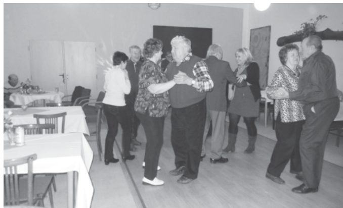
Ten kdo tančí a zpívá je na světě rád, ten kdo tančí a zpívá, ten se umí smát!

• Počasí si z nás v měsíci březnu tropilo legraci. Paní Zima po vlažném nástupu udeřila a teplota se držela i pod více než -15°C, aby během týdne vystoupila na +15°C. I to jistě přispělo k chřipkové epidemii, která trápila celou republiku.